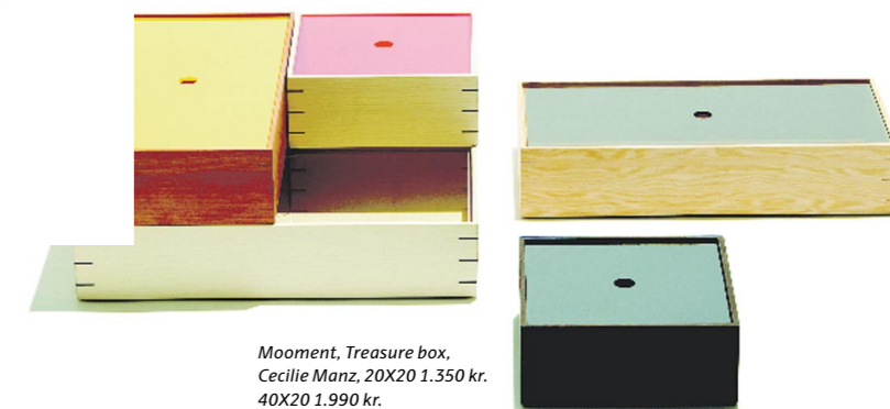
Mooment, Treasure box, Cecilie Manz, 20X20 1.350 kr. 40X20 1.990 kr.