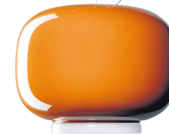
»Chouchin« designet af Inna Vautrin. Lampen er i lakeret blæst glas, 2.897 kr.