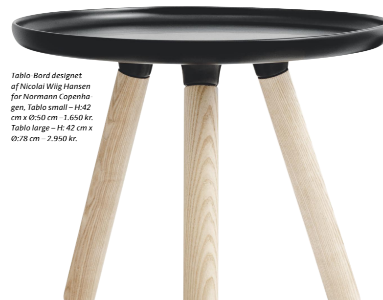
Tablo-Bord designet af Nicolai Wiig Hansen for Normann Copenha- gen, Tablo small – H: 42 cm x Ø: 50 cm – 1.650 kr. Tablo large – H: 42 cm x Ø: 78 cm – 2.950 kr.