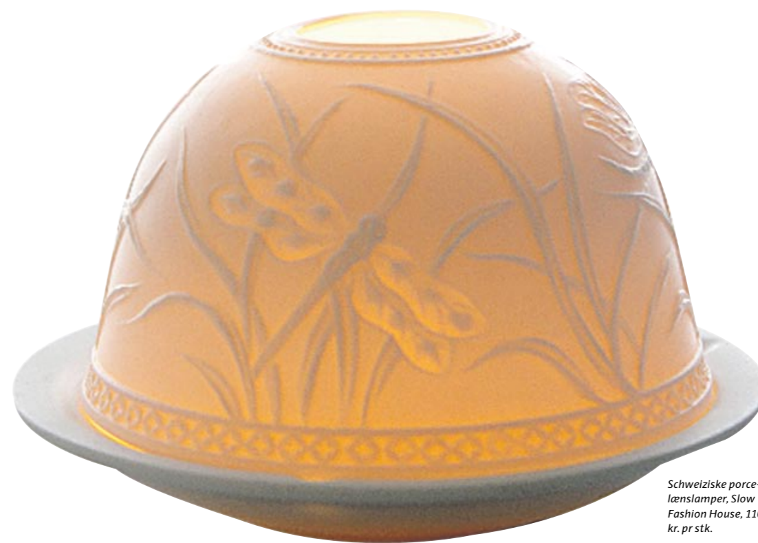
Schweiziske porcelænslamper, Slow Fashion House, 110 kr. pr stk.