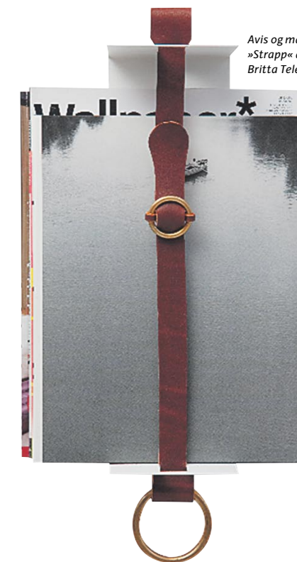
Avis og magasinholder »Strapp« designet af Britta Teleman, 950 kr.