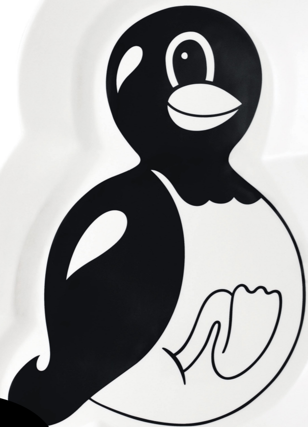
Fadet fra serien »Friends«, designet af Troels Øder Hansen vs. HuskMitNavn, 950 kr.