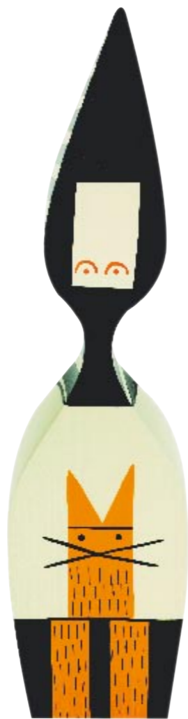
Dukke (i nye designs, taget fra gamle designs og genoptrykt) af Alexander Girad, 818 kr.