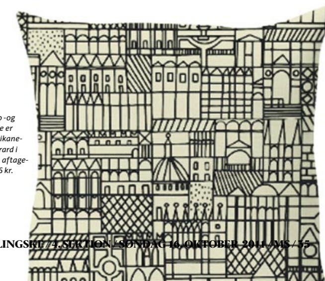
Suita-pude i retro- og klassiske mønstre er designet af amerikane- ren Alexander Girad i 1950'erne. 60x60 afte- ligt betræk, 2.356 kr.